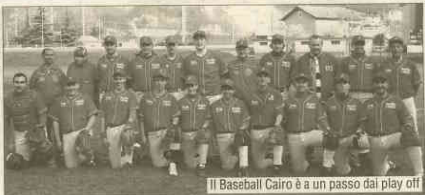
Il Baseball Cairo è a un passo dal play off